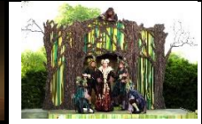
Romeo und Julia

Seit 1989 widmet sich Art Carnuntum dem philosophischen Kulturerbe Europas und präsentiert alljährlich bedeutende Stücke des klassischen Welttheaters in spannenden, zeitgemäßen Inszenierungen renommierter Künstler und internationaler Theaterensembles.