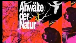
Anwälte der Natur