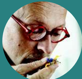
Johannes Gutmann SONNENTOR www.sonnentor.com